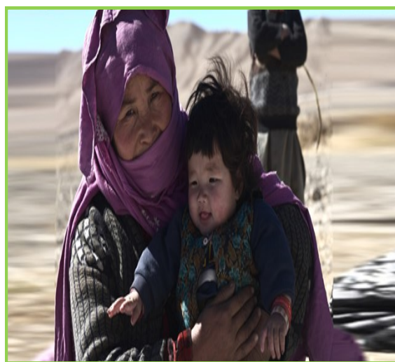
ACBAR Picture: Do Not Forget Afghanistan Campaign

Independent and needs-based humanitarian aid flow to Afghanistan is paramount to ensuring, impartial and neutral access to affected communities. The Humanitarian Response Plan (HRP) and the Common Humanitarian Fund (CHF) are therefore framed outside the national Aid Management Policy (AMP) and the Tokyo Commitments which ask for 80% alignment with National Stability Program 50% of aid to be on-budget. Humanitarian action is globally accepted to be ring-fenced from these mechanisms to ensure the impartiality. It is an absolute imperative that this continues.