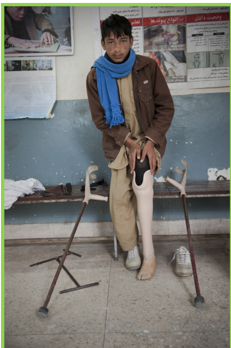
Do Not Forget Afghanistan Campaign

Afghanistan's protracted internal armed conflict, insurgency, and political instability have internally displaced over 700,000 Afghans. As of 30 April 2015, 1,989 Afghans were injured and 978 Afghan civilians killed in conflict situations, throughout the country. Aid workers are also increasingly becoming victims. One aid worker killed in their line of duty is one too many. In 2014, 36 aid workers were killed and 95 wounded throughout Afghanistan. By June 2015, as many as 26 NGO workers have been killed, 17 wounded and 41 abducted.