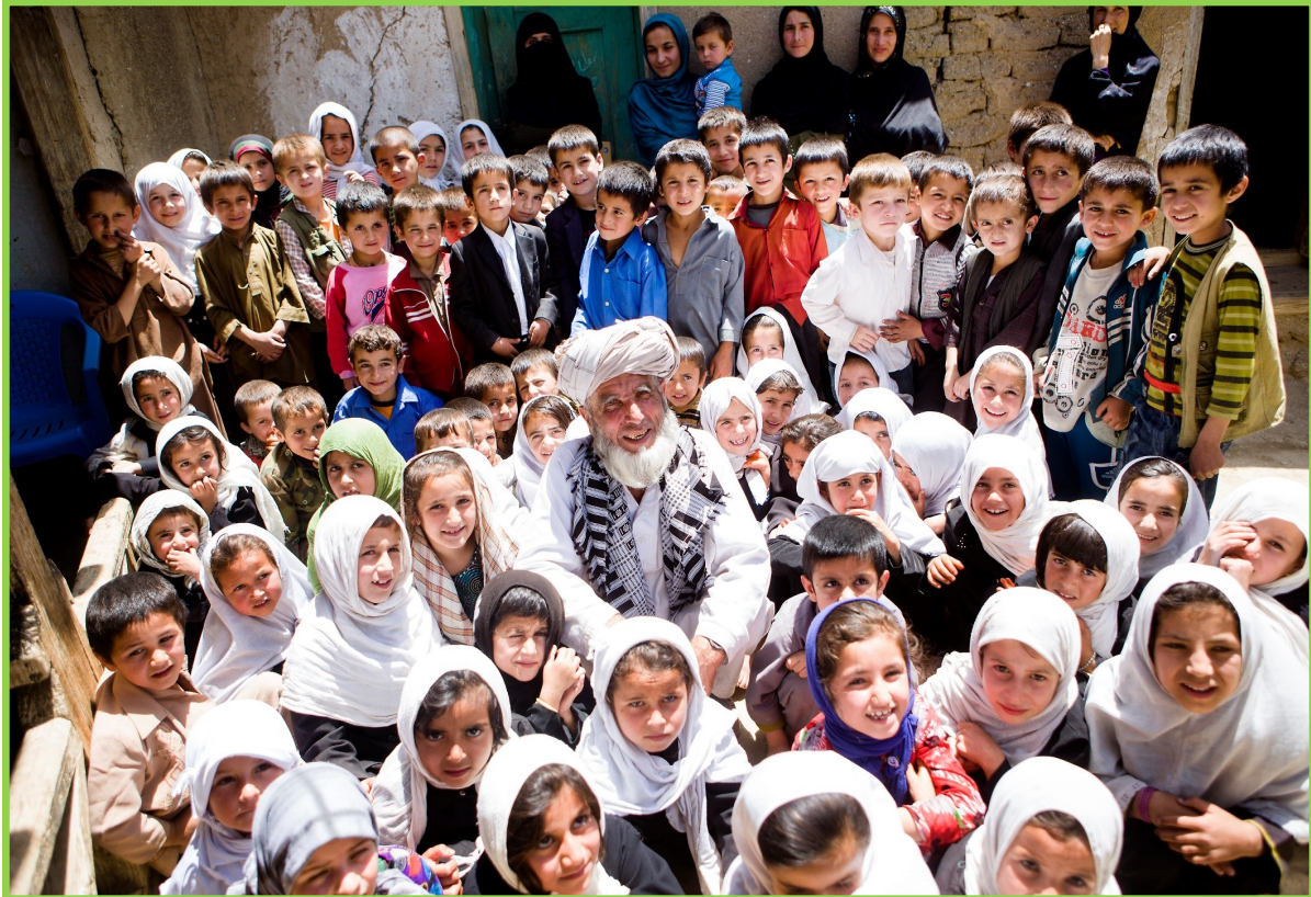
تصویر اکبر: کمپاین افغانستان را فراموش نکید

استقلالیّت: فعالیت های بشری باید از هر نوع اغراض سیاسی، اقتصادی یا اهداف دیگر پاک بوده تا فعالان بشری در ساحات تطبیق فعالیت های بشردوستانه مستقلانه عمل نمایند.