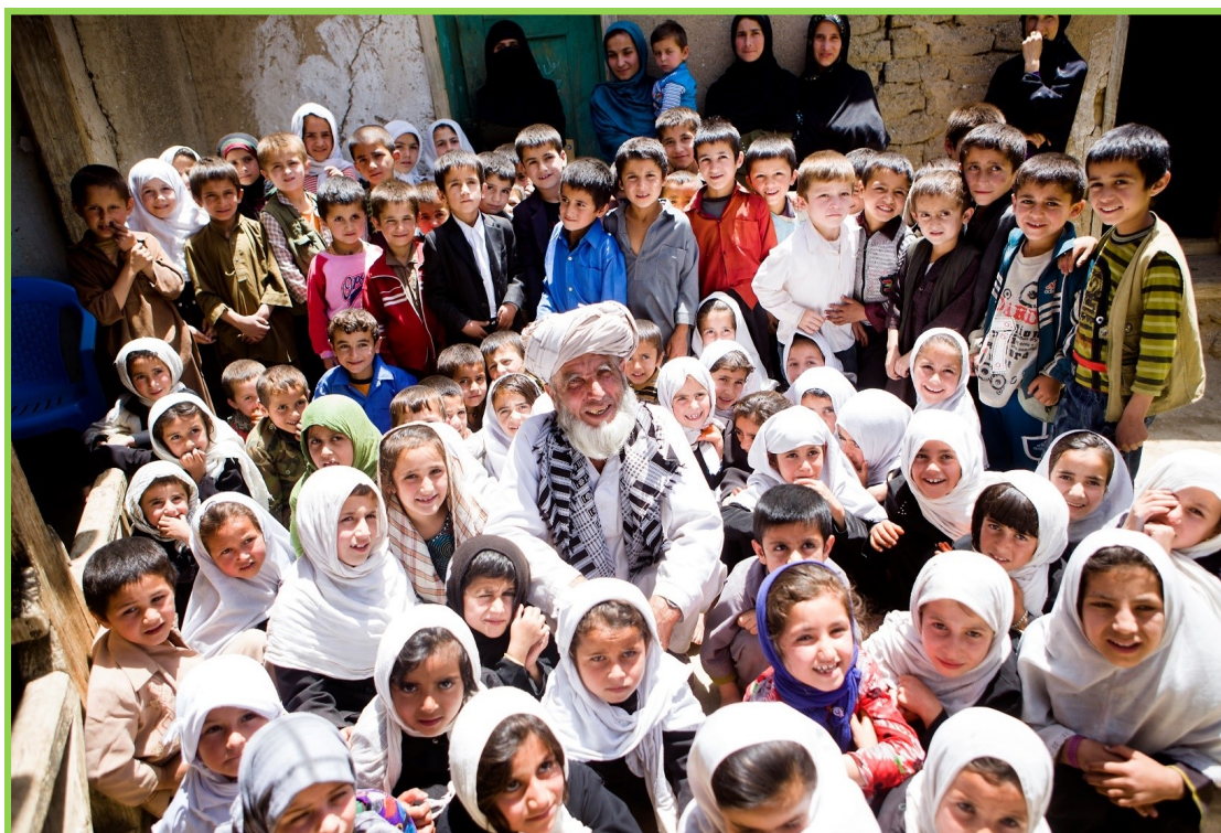
ACBAR Picture: Do Not Forget Afghanistan Campaign

Independence: Humanitarian action must be autonomous from the political, economic, military or other objectives that any actor may hold with regard to areas where humanitarian action is being implemented.