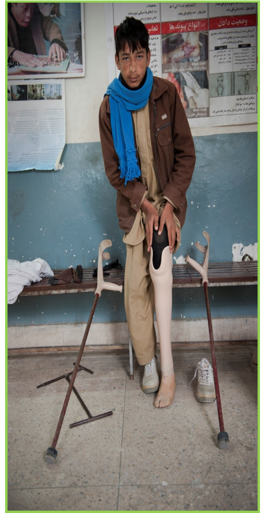
تصویر اکبر: کمپاین افغانستان را فراموش نکنید

رسیدگی و پاسخگویی به بحران ها کار بسیار پیچیده و پرهزینه میباشد. نهاد های بشردوستانه که به بحران ها رسیدگی میکنند باید مورد توجه مجدد قرار گیرند. در برخی مواقع، سازمان های غیر دولتی از سوی دولت های تمویل کننده تحت فشار قرار میگیرند تا کمک های بشردوستانه را بخاطر اهداف سیاسی شان رهبری نمایند و اکثر اوقات این کار خود را دخالت در امور بشردوستانه و در خطر بودن کارمندان و مستفید شده گان عنوان میکنند. در بسیاری جاها معلومات مورد نیاز موجود نبوده و جمع آوری معلومات ارزیابی ناممکن میباشد. بدون این معلومات تحلیل مناسب و دانستن خلا های کمک های بشردوستانه غیر ممکن میباشد و به نوبه خویش میتواند توانائی فعالان بشردوستانه را برای دادخواهی به رسیدگی موثر تحت تاثیر قرار دهد و باعث تفهیم ناقص تمویل کننده گردیده و یک بی میلی را برای فراهم آوری بودجه فعالیت بشر دوستانه بوجود می آورد. در جریان مرحله جدید تحول باید تعهدات واضح صورت گیرد و رسیدگی به اساس نیازمندی و پول کافی توسط تمویل کنندگان فراهم گردد. این کار فعالان بشردوستانه را کمک می نماید تا برای درازمدت قابل پذیرش باشند و کمک های اساسی را به جاهای که سخت آسیب پذیر میباشند تخصیص دهند.