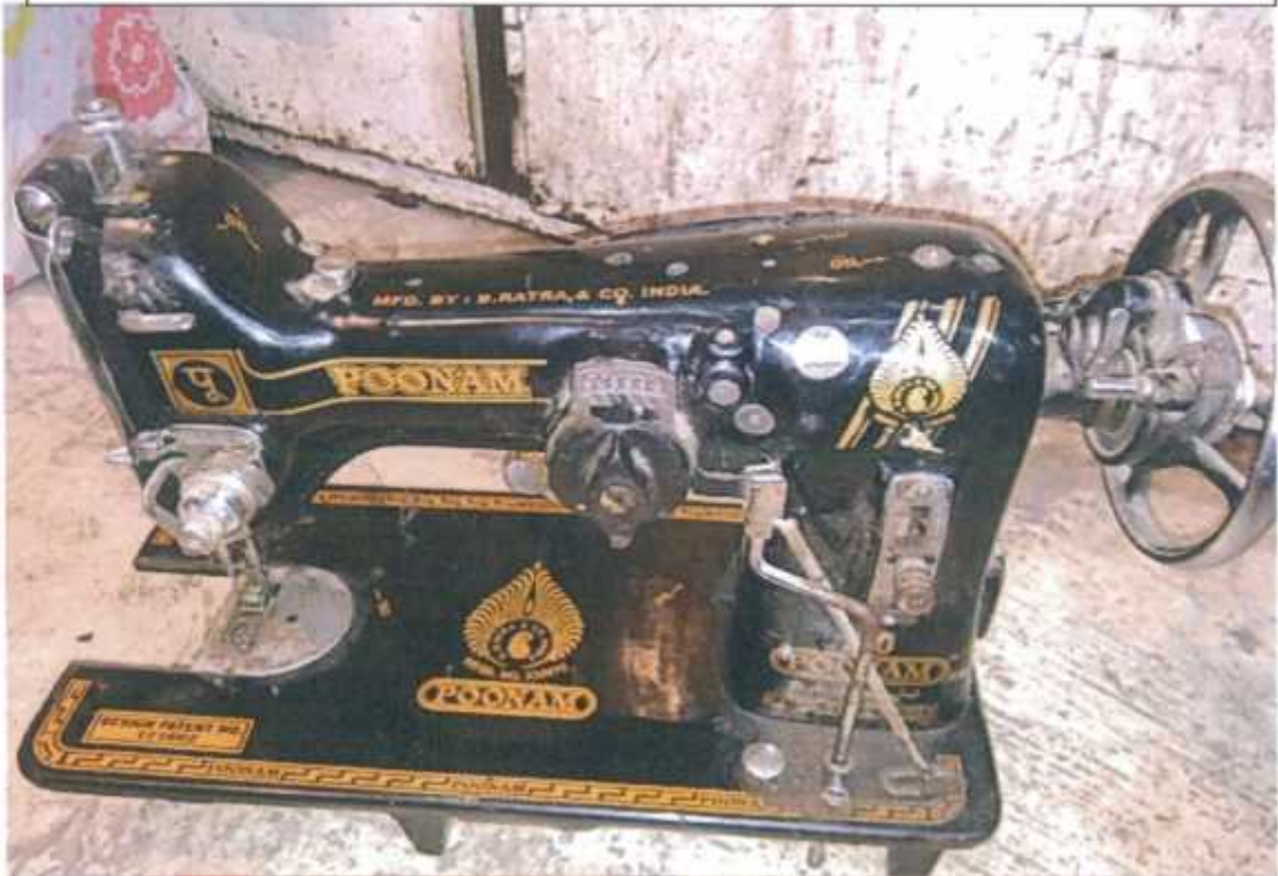
Sewing Machine POONAM